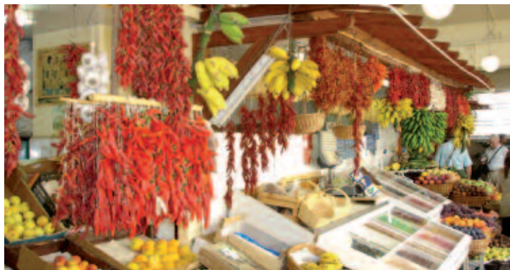
Étal du marché de Funchal

Piscine avec matelas et parasols à disposition. Prêt de serviettes de bains. Avec participation : Tennis. Possibilité de louer le matériel (avec supplément). 2 heures de tennis offertes par semaine sur le court de l'hôtel.